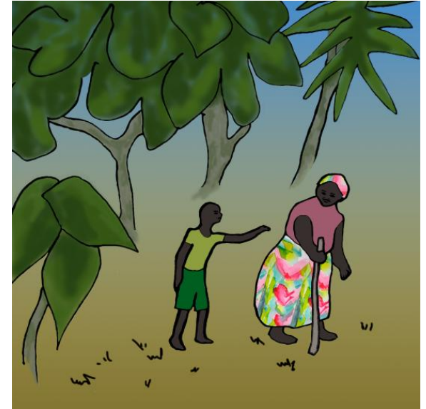
መሬት ደሓነ ሰላም ምስኩዕነ፡ ቲንጊን ዓባዩን ካብ ዝተሓብእዎ ወዲኡም።