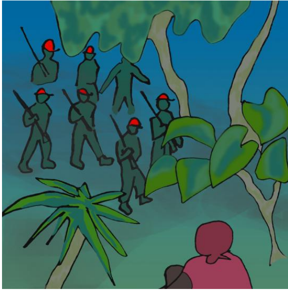
ሽቡ እቶም ወታሃደራት ተመሊሶም መጹ።