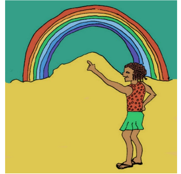
Waxaan arkaa qaanso roobaad.