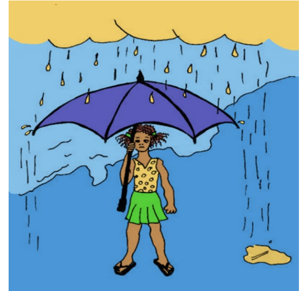
Roob baa da'ayo.