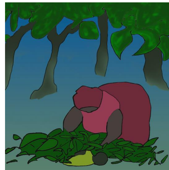
مادر بزرگ، تینگی را زیر برگ‌ها پنهان کرد.