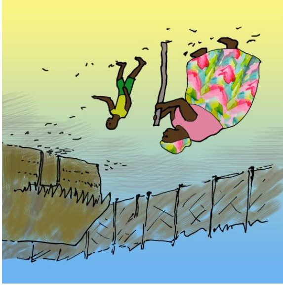
Ostrożnie i po cichu wrócili do domu.