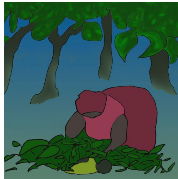
Babcia ukryła wnuczka pod liśćmi.