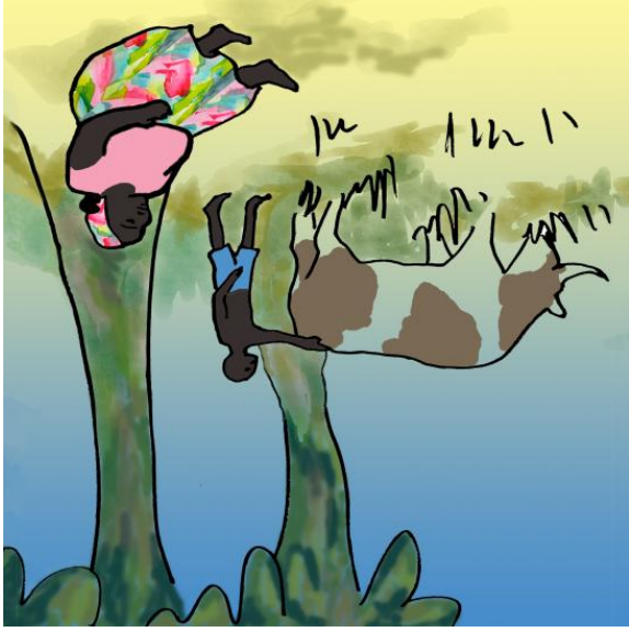
Tingi i krowy