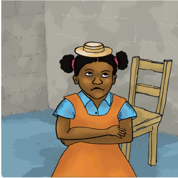
این کلاه کوچک است.