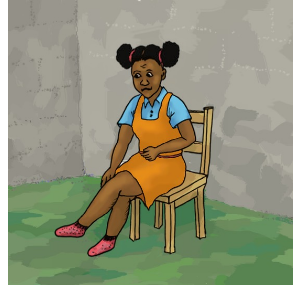
جوراب ها کوچک هستند.