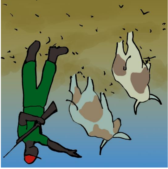
Se llevaron las vacas.