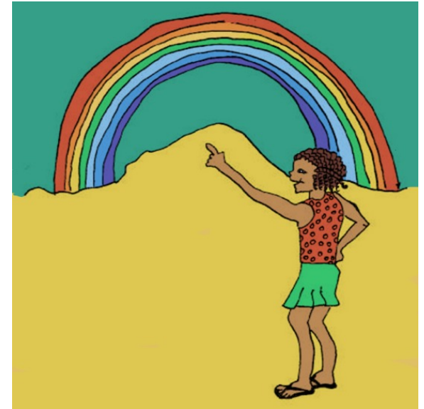
I see a rainbow.