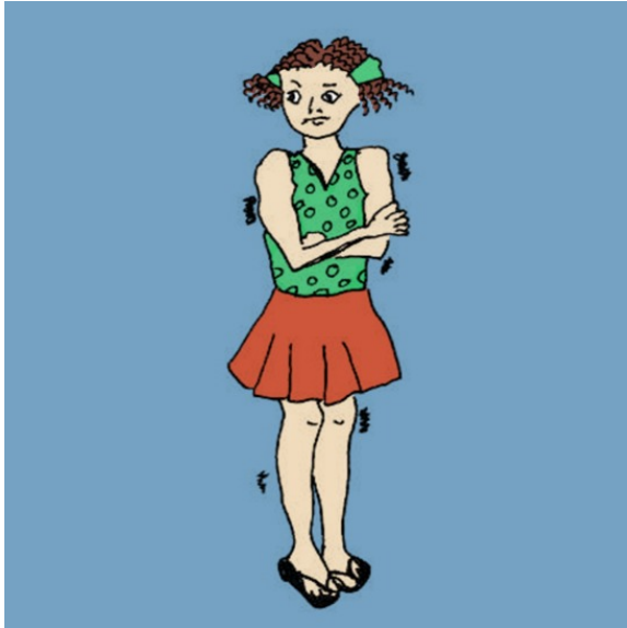
It is cold.