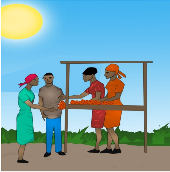
خەلك له بازارى ميوه دهكرن.