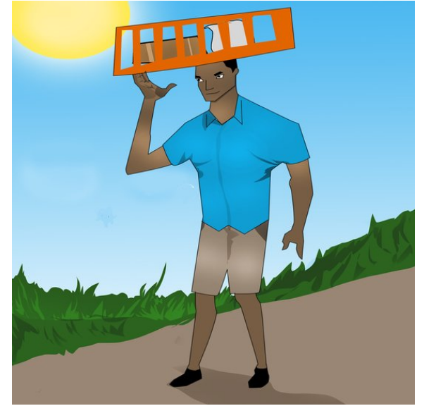
تۆم سندوقه كهى له سهر سهرى دادهنى و بهره و مال بهرئ ده كه وئ.