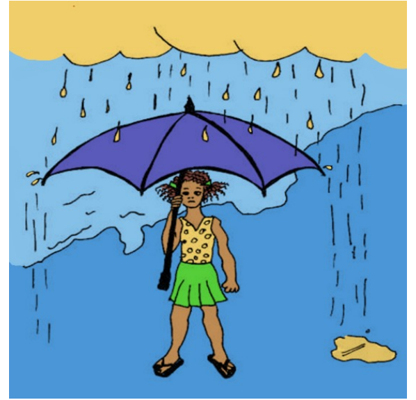
باران ده باری.