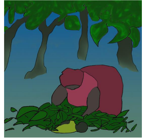
نہ نکی، تینگی لہ ژیر گہ لاکاندا شاردہ وہ.