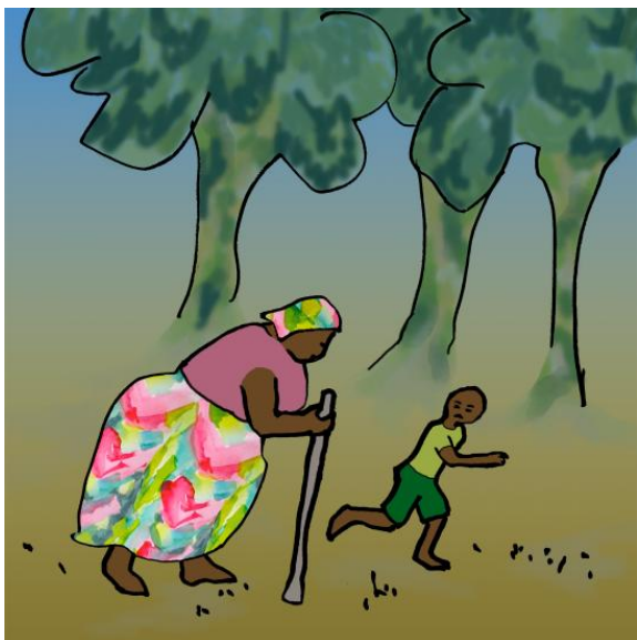
تینگى و نهنگى هه لاتن و خویان شاردهوه.