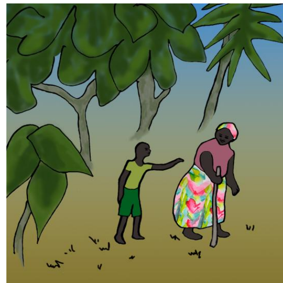
کاتیک بارودوخه که ئاسای بۆوه، تینگى و نهنگى هاتنه دهرهوه.