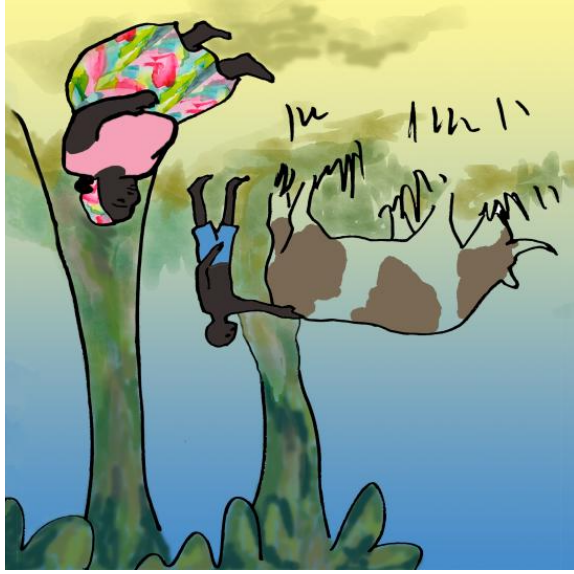
Tingi iyo lo'dii Tingi och korna